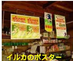
イルカのポスター

取材の帰りに「N」さんこい食べたってとリッパなイチゴを2パック「おっなんなよ、ほいてすまんよう」遠慮なしに戴きました。大変美味しかったです。「ちょっと粋ふやいたろ」(笑い)