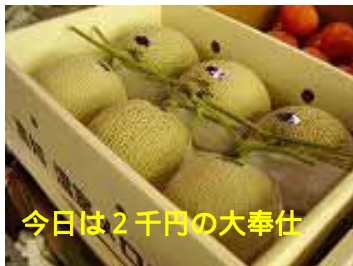
今日は2千円の大奉仕