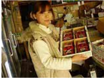
「美味しそうなイチゴでしよう」と山彦・看板若奥様