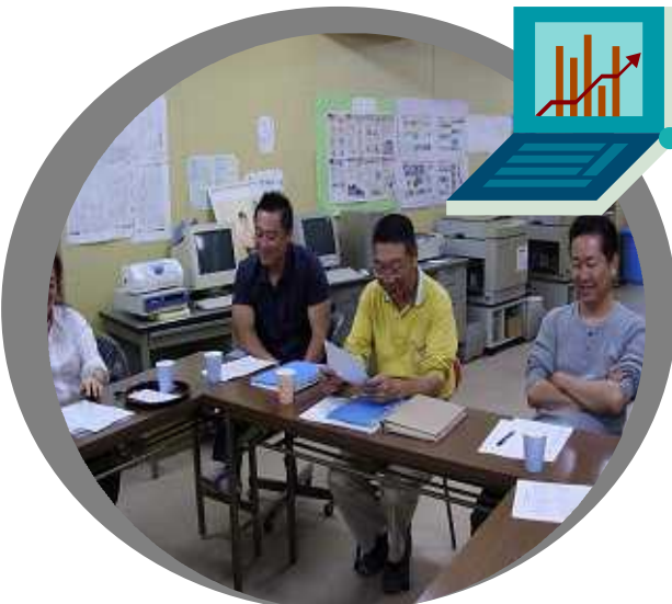
「白黒写真もちよっとしびいる、PC新しなったら色々てんごしとなってくるさかどもならな三尾川大先生。